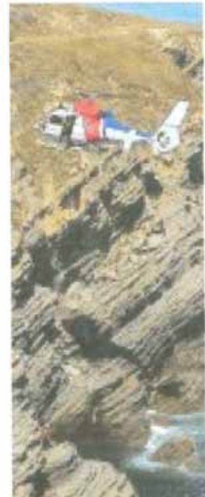
Rescate en Covarón

Damos cobertura a una regata de traineras en la Ría de Bilbao, a la altura del Puente Colgante.