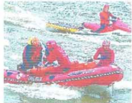
Voluntarios participan en la exhibición

26-11-05 Realizamos maniobras de exhibición de salvamento marítimo como parte del simulacro del Día del Voluntario de Cruz Roja.