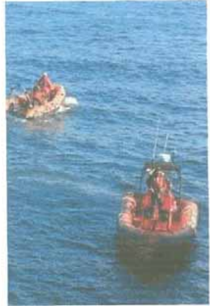
Dos embarcaciones de Cruz Roja buscan al desaparecido

Asistimos a una embarcación con problemas en el Puente de Rontegi y le damos remolque hasta Puerto Deportivo de Getxo.