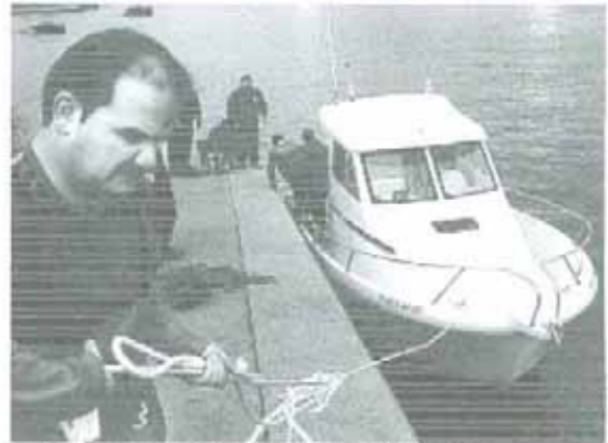
El barco es amarrado en Zierbena

21-11-05 Acudimos a milla y media al Oeste-Sudoeste de Punta Galea por aviso del avistamiento de una embarcación a la deriva sin tripulación.