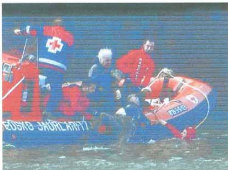
Buceadores voluntarios rescatan el cadáver del coche sumergido