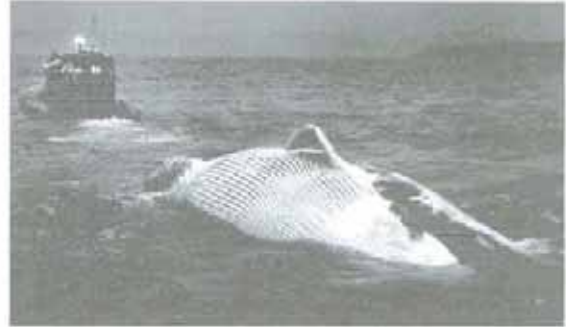
La ballena es remolcada por la Arriluze III

13-12-05 Remolcamos el cuerpo de una ballena que ha quedado encallada en la bocana del Puerto de Zierbena y la dejamos amarrada en el Muelle de Ampliación del Puerto de Santurtzi.