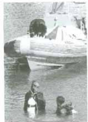
Buceadores rescatan el cuerpo del coche.

El Grupo de Buceadores rescata el cadáver del conductor de un coche caído a la Ría de Bilbao, a la altura de Lutxana.