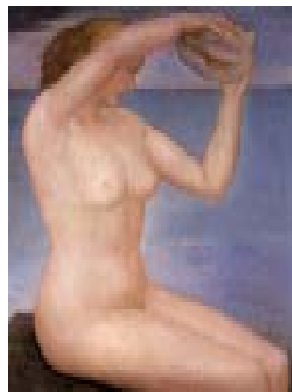
Desnudo de frente, s.d. Óleo sobre tela