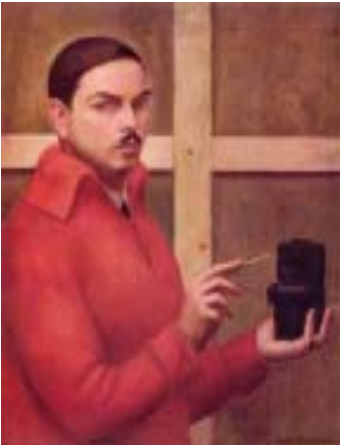
Angel Zárraga, Autorretrato, 1930 / Oleo sobre tela / 73 x 57 cm. [1886-1946]