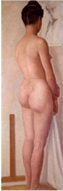
Desnudo de cuerpo entero, 1945

No perteneció su obra a la llamada Escuela Mexicana de Pintura, vigente desde 1922. Habló en memorias y cartas acerca del amor a su país, conoció su cultura natal, pero México fue distante para él, por su ausencia de tantos años.