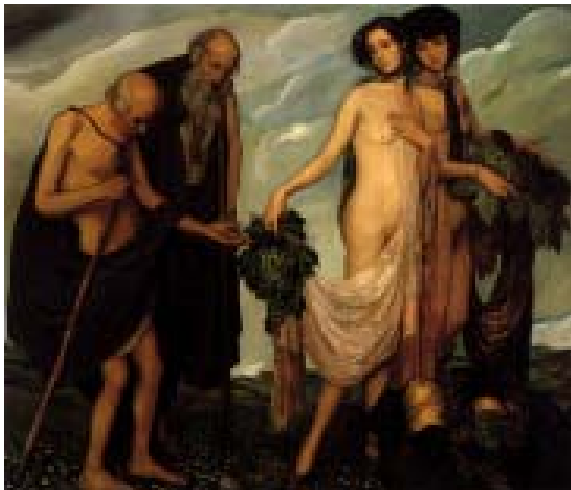
La dádiva, 1910 Oleo sobre tela, MUNAL-INBA

Declara Zárraga: «No pinto un cuadro antes de tener de él, fija en la mente, la imagen perfecta, con sus líneas y colores; imagen cuya formación obedece, naturalmente a una armónica selección anterior de las ideas reunidas en apuntes y bocetos. Eso es lo principal; lo demás se reduce a labor de manos; a trasladar, del cerebro a la tela, fielmente, mi concepción interna, para realizar, la cual basta el indispensable dominio del oficio...» (extraído de Arte y Letras , México, 29 enero 1911)