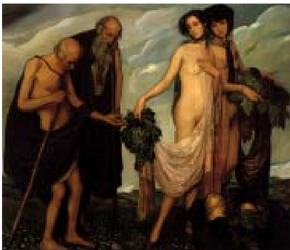
La dádiva, 1910 Oleo sobre tela, MUNAL-INBA

Declara Zárraga: «No pinto un cuadro antes de tener de él, fija en la mente, la imagen perfecta, con sus líneas y colores; imagen cuya formación obedece, naturalmente a una armónica selección anterior de las ideas reunidas en apuntes y bocetos. Eso es lo principal; lo demás se reduce a labor de manos; a trasladar, del cerebro a la tela, fielmente, mi concepción interna, para realizar, la cual basta el indispensable dominio del oficio...» (extraído de Arte y Letras , México, 29 enero 1911)