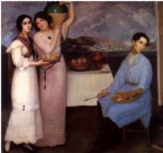
El pan y el agua. 1911 Óleo sobre tela, colección CNIC

La base de su formación se encuentra en el clasicismo francés decimonónico y en la pintura española de El Greco, Goya, Zuloaga y Sorolla. Exploró el cubismo, amó el color, el exotismo, la decoración, como el Art-Nouveau; recurrió al profundo y simbolismo. Fue pintor religioso, pintor de retratos y de temas deportivos. Alguna vez incursionó en un exiguo mexicanismo, pero mejor trató los anteriores temas. Una de las grandes virtudes de su trayectoria, es la de haber guardado la unidad dentro de la multiplicidad de estilos, asuntos e intenciones que abordó.