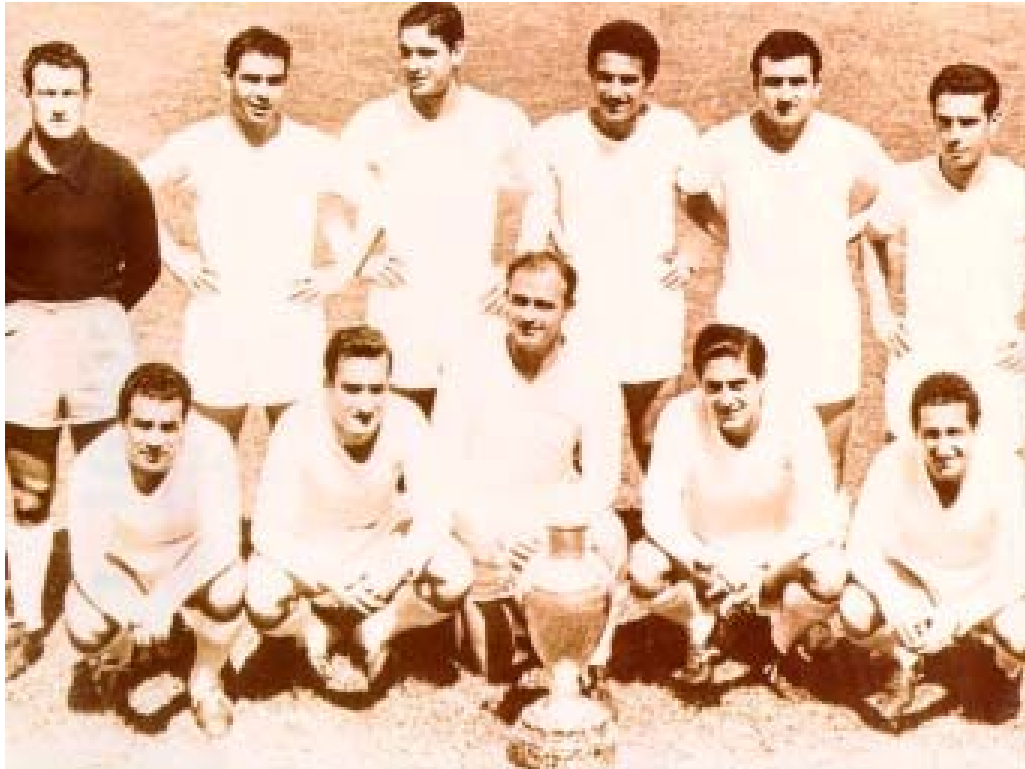
Alonso, Atienza, Marquitos, Lesmes, Muñoz, Zárraga , Joseíto, Marsal, Di Stefano, Rial, Gento