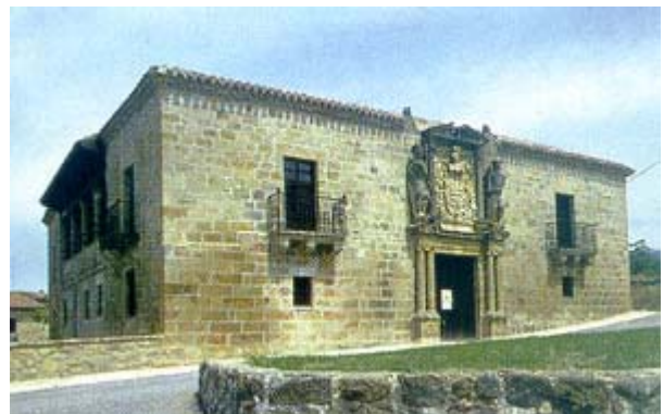
ZALDUONDO. Palacio de Lazarraga. Renacimiento s. XVI