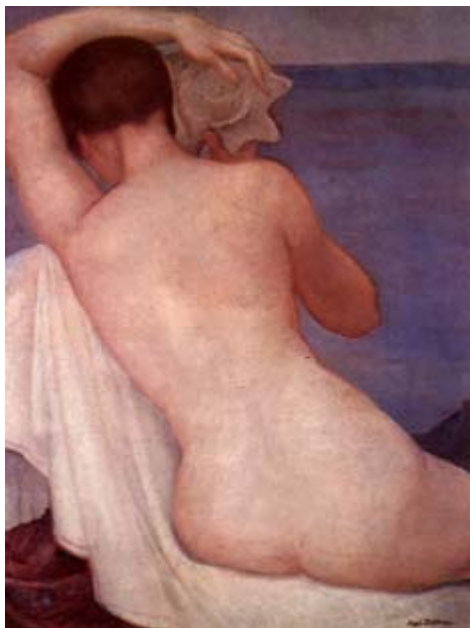
Desnudo de espalda con caracol, 1926 Óleo sobre tela, colección CNIC