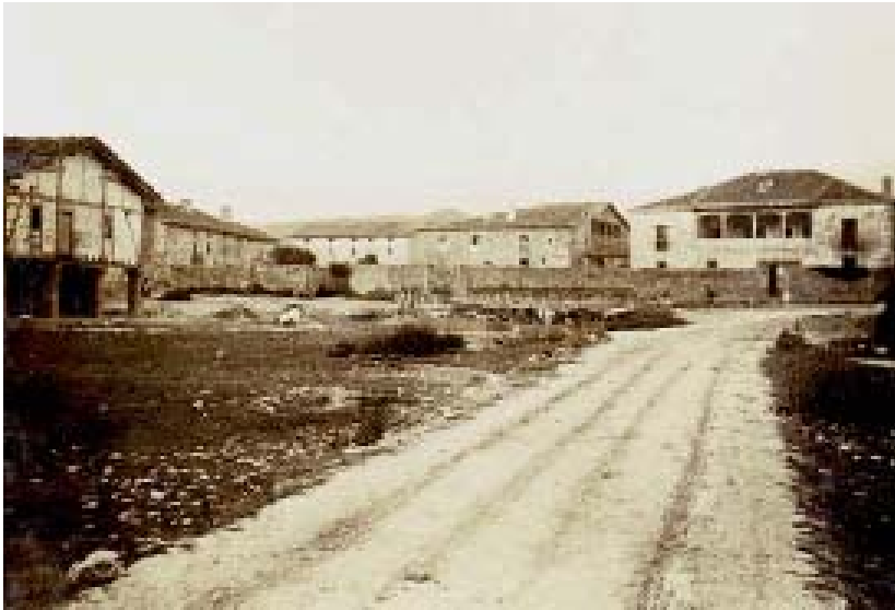
VISTA DEL CONJUNTO DEL MUNICIPIO DE ZALDUONDO (ALAVA) CON EL PALACIO LAZARRAGA EN EL FONDO. SE VE LA SOLANA DE LA FACHADA SUR , SUCESORA DE LA CASA TORRE DE LOS AMEZAGAS Y LAZARRAGAS.

El palacio de los Lazarraga-Lecea en Zalduondo(ALAVA) fue erigido a finales del XVI por el conde de Villafranca Juan López de Lazarraga, organizado en sencillos volúmenes. Aparte de una solana y el patio, destaca la fachada principal, en la que sobre la puerta adintelada, flanqueada por columnas, se sitúa un enorme blasón entre columnas y esculturas gigantescas de guerreros, por lo que se le conoce también como la «Casa de los Gizones». Desde 1984 está declarado Monumento Histórico-Artístico. En las dos salidas de Zalduondo existen puentes y cruces de término, que mantienen viva la tradición de aquella ruta jacobea. Junto al puente de Zubizábal, sobre el río Amézaga y en la salida hacia Salvatierra, la cruz de «Calzadausi», un crucero típico del siglo XVI, que ostenta el escudo de los Lazarraga.